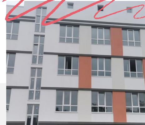
Гімназія № 59