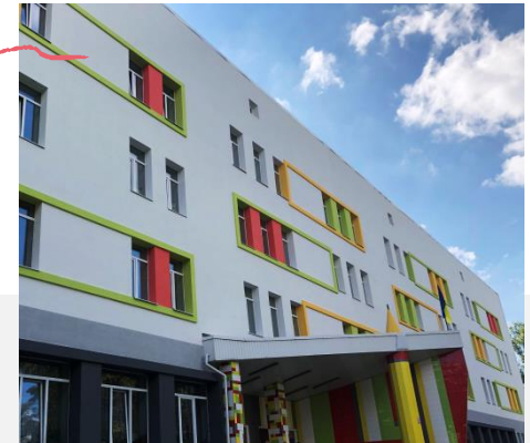
Гімназія № 179