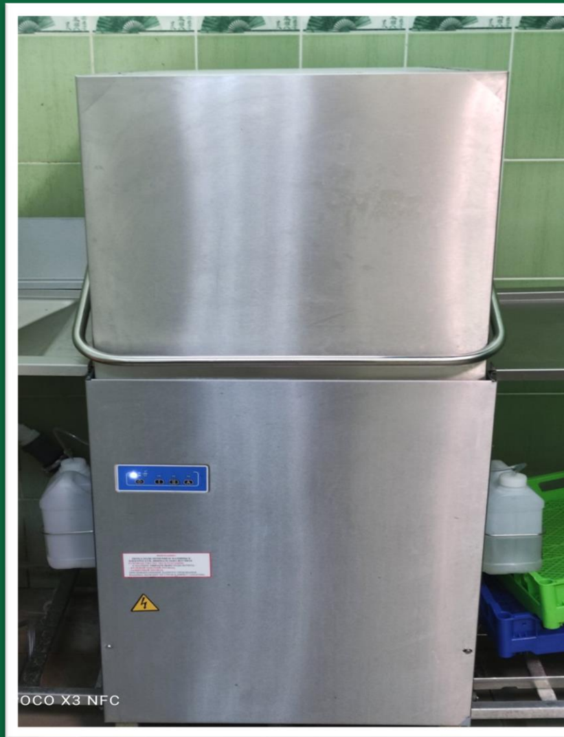
ПОСУДОМИЙНА МАШИНА (ЗЗСО № 78, 80, 117, 133, 181, УГЛ)