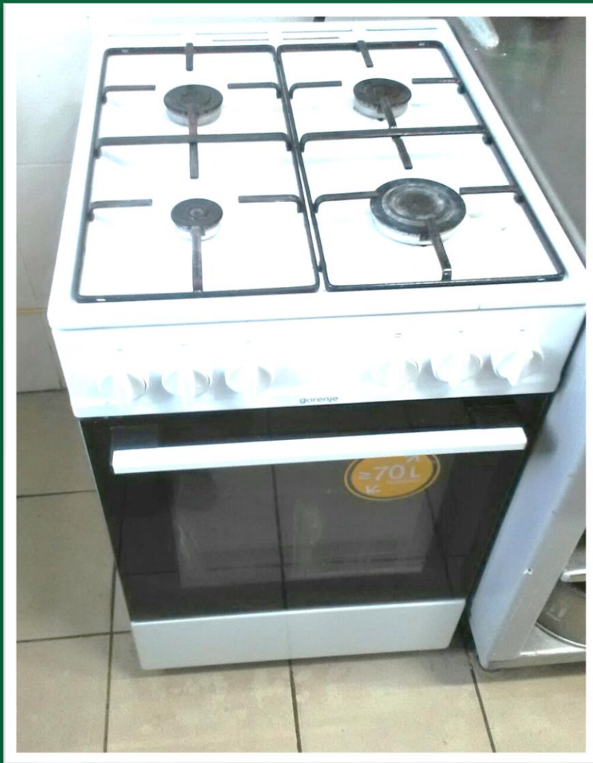
ГАЗОВА ПЛИТА (ЗЗСО № 56 (2))