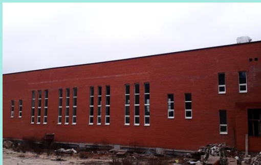
ЗЗСО №151 79,1 млн.грн.