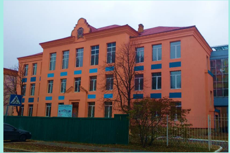
ЗЗСО № 23 67,2 млн.грн. Деснянська РДА