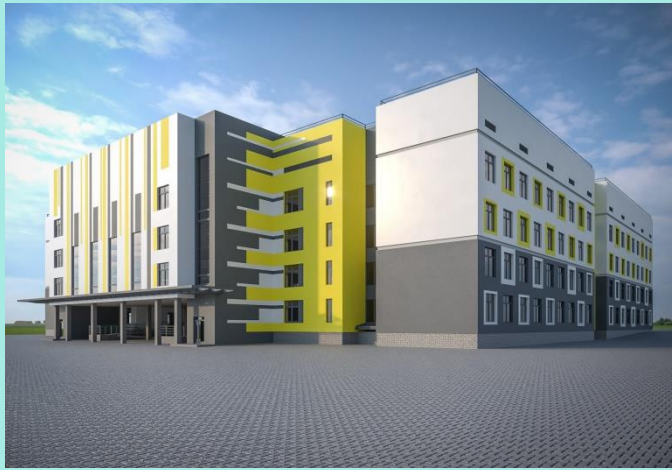
ЗЗСО Осокорки, м.н 10, діл. 65, 66 443,0 млн.грн. КП «ЖИТЛОІНВЕСТБУД-УКБ»