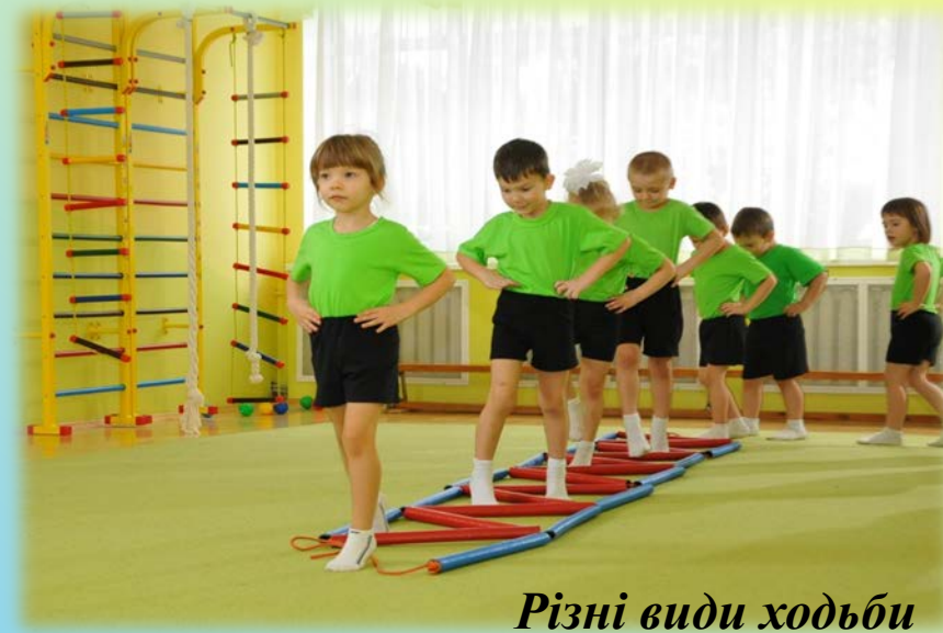
Різні види ходьби