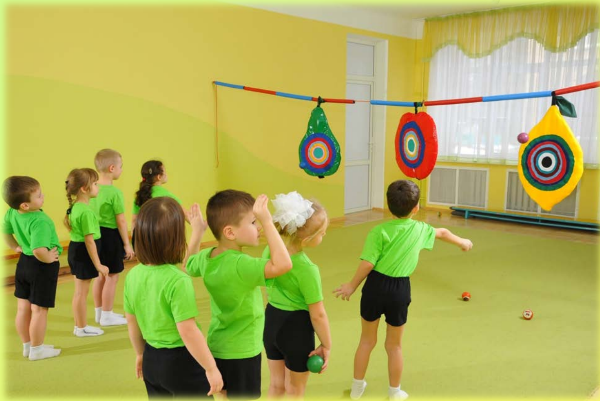
Метання у вертикальну ціль

Ми в ігри різні граємо, в мішені попадаємо. А мішені в нас фруктові та різнокольорові