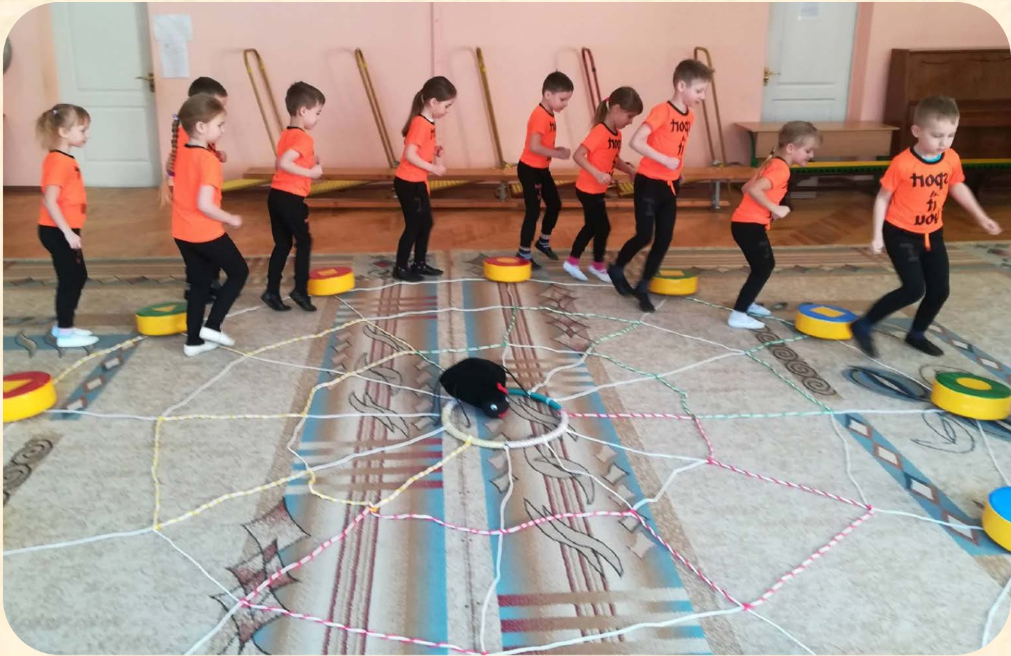
Біг змієюю між подушечками