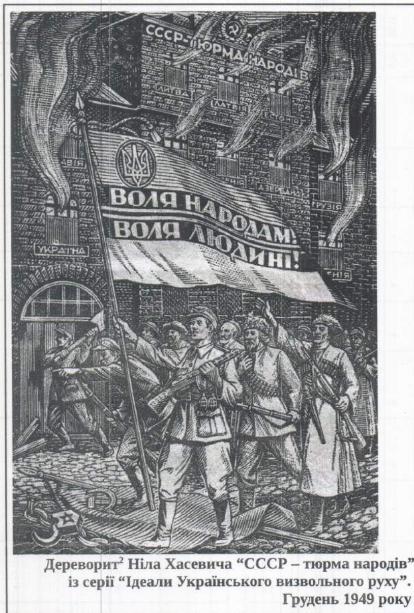
Дереворит 2 Ніла Хасевича "СССР – тюрма народів" із серії "Ідеали Українського визвольного руху". Грудень 1949 року

тактики. У регіонах, де визвольний рух був найбільше знесилений, повстанські загони демобілізували та перевели на конспіративно-підпільні методи. Дрібні повстанські групи нападали на установи влади, здійснювали диверсії на лініях комунікацій. Таким чином підпільники перешкоджали закріпленню режиму на місцях.