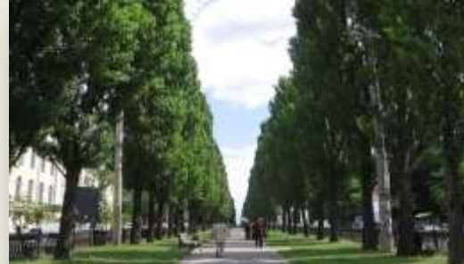
Меморіальний будинок, - музей П. Т. Шевченка