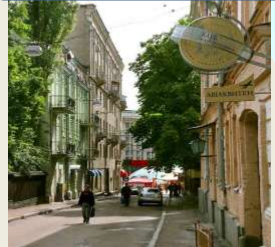
Провулок Тараса Шевченка