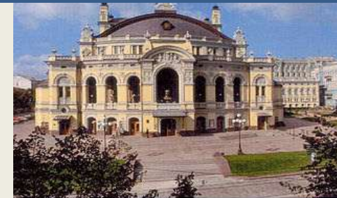
Національний театр опери та балету ім. П. Шевченка