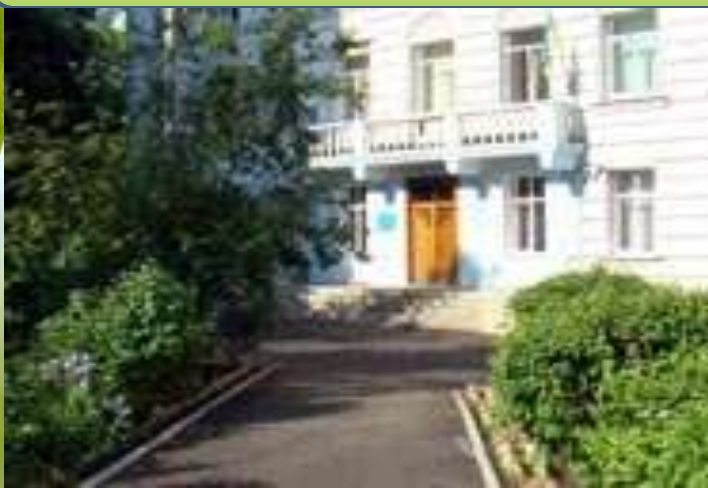
СШ I-III ступенів № 112 ім. Т. Шевченка