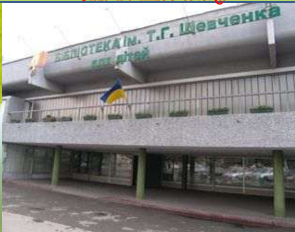
Центральна дитяча бібліотека імені Т. Г. Шевченка