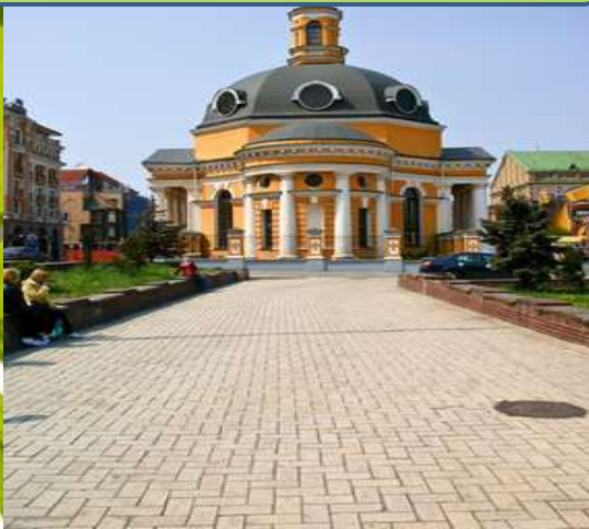
Церква Різдва Христового