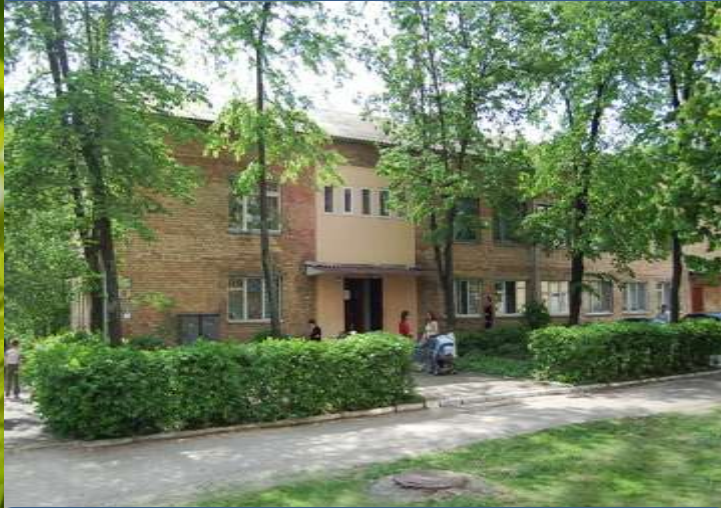
СШ I-III ступенів № 112 ім. Т. Шевченка