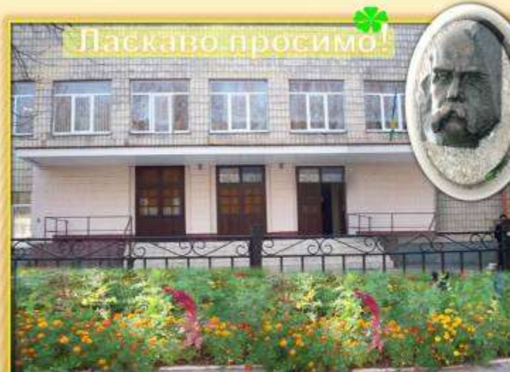
Гімназія ім. Т. Шевченка № 109